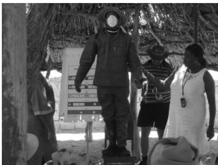
Un équipement approprié et bien entretenu est critique pour une utilisation sûre des pesticides.

Dans la mesure où les brigades villageoises jouent un rôle prépondérant dans la gestion des nuisibles, elles devraient encourager à comprendre et à promouvoir l'adoption des options de contrôles non chimiques autant que possible et décourager la dépendance systématique aux pesticides. De préférence, les participants ont trois jours de formation intensive en gestion de pesticides et d'Nuisibles et ensuite sont